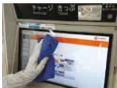
券売機タッチパネルの消毒