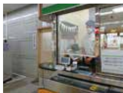
改札窓口でのビニールカーテン使用