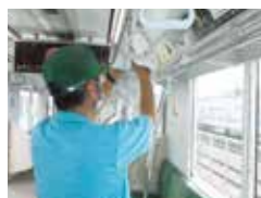
車内つり革の消毒