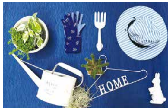
おしゃれな雑貨でガーデニングを楽しく。*写真の商品は、「ガーデンセンター」で販売。