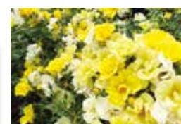
小型のつるバラとしても楽しめる、リモンチェッロ。

バラ初心者には、花付きがよく、繰り返し花を咲かせる丈夫で伸びすぎない「半つるバラ」がおすすめ。