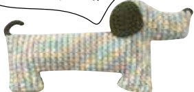
ダックスフントの編み図(880円)も販売。